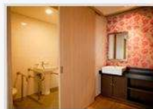
<사진설명: 숙소 전경>