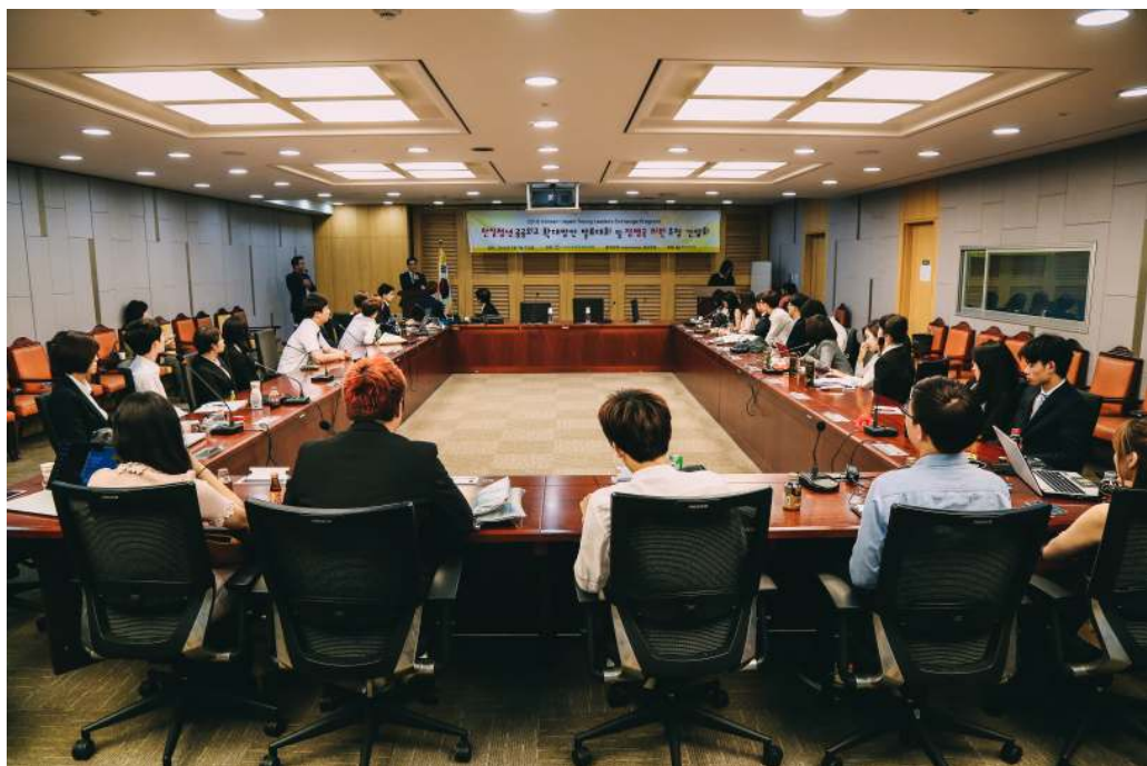
<사진설명: 2016년 9월 7일, 한일청년 공공외교 확대방안 국회에서의 발표 현장>