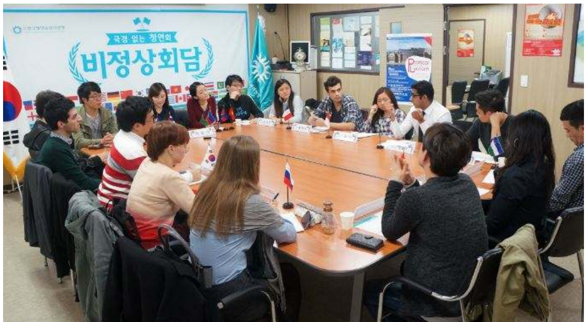
<사진설명: 2014년 11월 4일, 세계 청년 간담회 현장>

세계 각국 청년들의 비정상회담 석학들의 무료강연 그리고 청년리더와의 만남 강원도 양구, 'DMZ 두타연 생태 트래킹' 모두 한마음으로! 세계 청년문화 장기자랑 국경없는 청연회, 「비정상회담 선언문」 발표