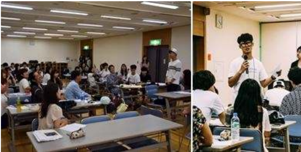
<사진설명: 2015년 한일청년 문화교류 프로젝트>