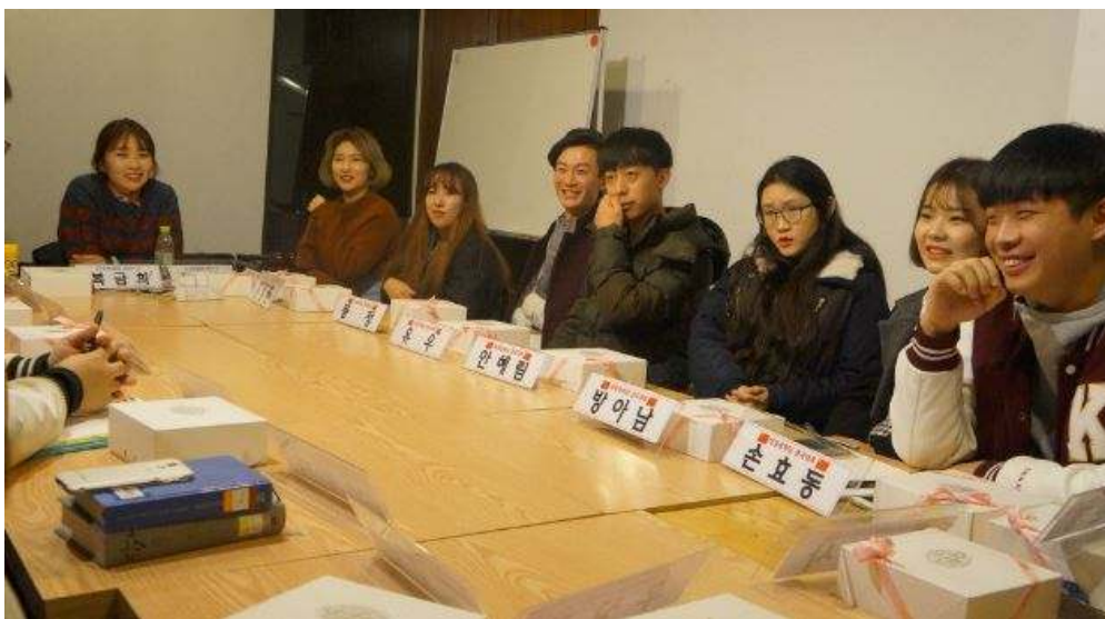
<사진설명: 2016년 한중청년 교류 프로젝트>