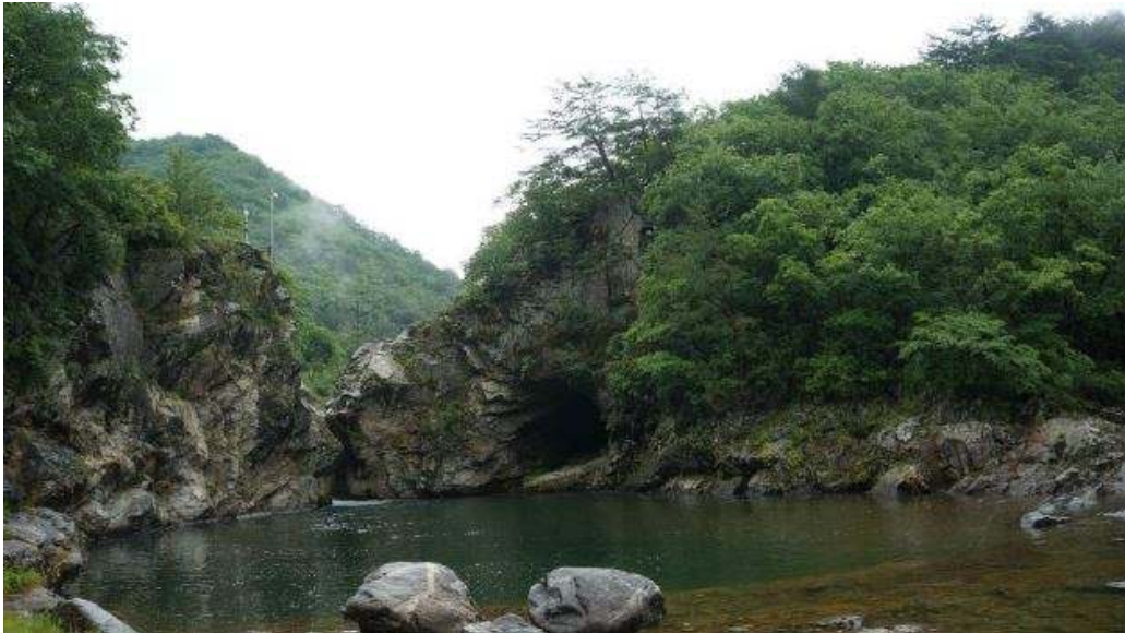
<사진설명: 강원도 양구, 두타연의 아름다운 모습>