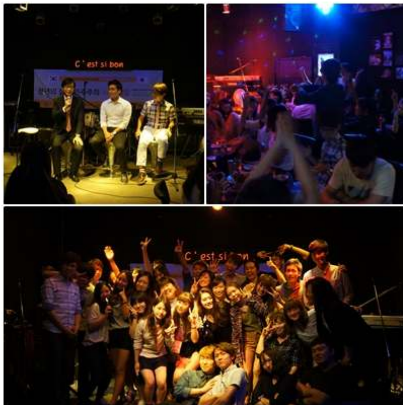
<사진설명: 뜨거운 열정과 우정을 나누며, 씨시봉에서>